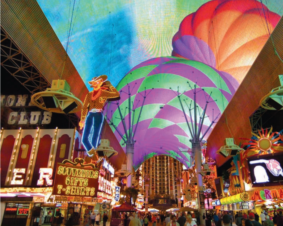
▲ L'hallucinante Fremont Street Experience de Las Vegas.