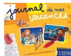
Journal de mes vacances 3 Feuilletez un extrait

Compagnons de voyage aussi amusants qu'instructifs, ces jolis albums fourmillent de nouveaux jeux et activités. Ces trois tomes, différents les uns des autres, tout en étant conçus dans le même esprit, permettent aux enfants de faire l'acquisition de nouvelles connaissances en lien avec leur lieu ou leurs activités de vacances. Les jeunes y retrouveront avec plaisir le sympathique personnage Edgar, qui les invite à raconter leurs vacances par des textes, des dessins, des collages, des passe-temps et d'autres activités.