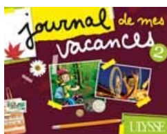
Journal de mes vacances 2 Feuilletez un extrait