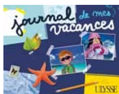
Journal de mes vacances Feuilletez un extrait

Parmi les quatre journaux de vacances pour enfants, il y en a forcément un qui plaira :